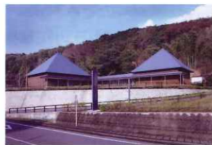
かなみ仏の里美術館

お菓子でほっこり笑顔になったら、モチーフとなった阿弥陀如来像にも、ぜひ会いに来てくださいね。 かなみ仏の里美術館でお待ちしています。